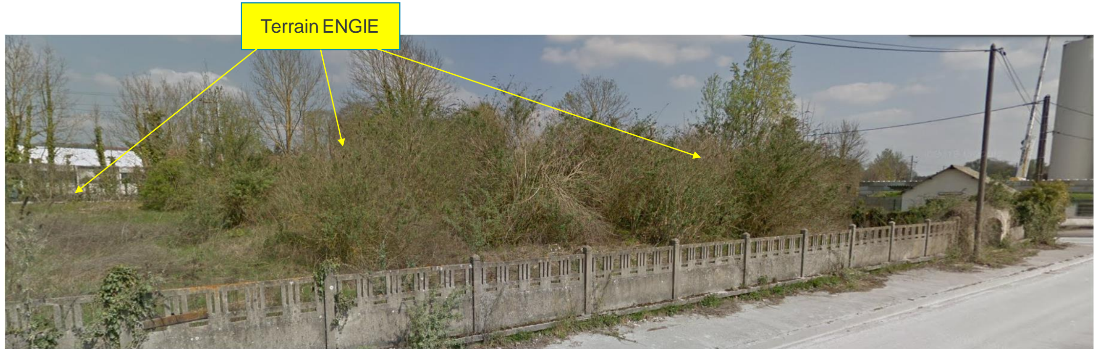
Le site vu du Quai de l'Oise