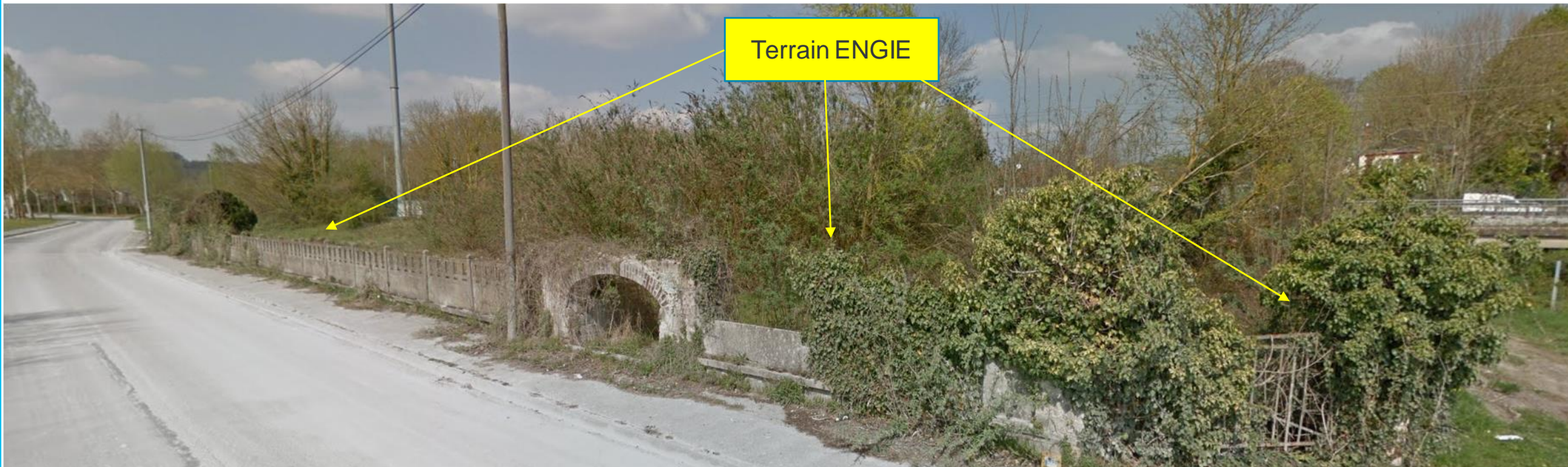
Le site vu du Quai de l'Oise