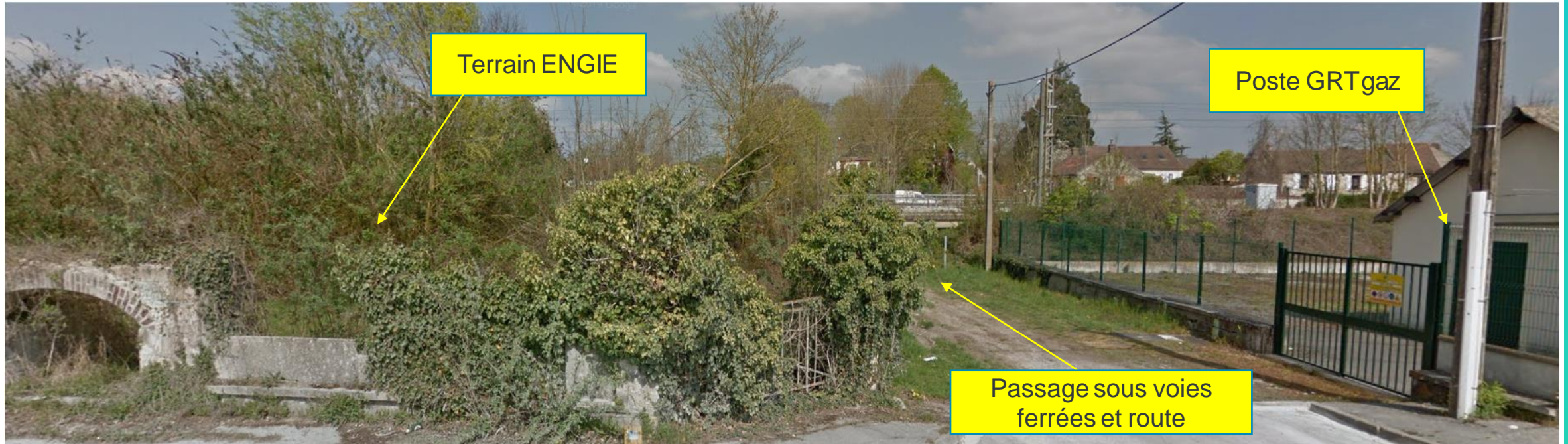
La limite Est du site vue du Quai de l'Oise